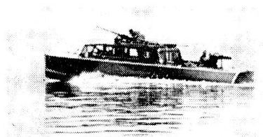
Patrouillenfahrt bei Nebel.

Schon beim ersten Feinkontakt hat der Kommandant das Wichtigste seines Auftrages nicht vergessen: laufende Meldungen über Stärke, Standort und Bewegungsrichtung des Gegners an die Grenztruppen durchzugeben. Diese können dadurch vom See her nicht mehr überrascht werden und rechtzeitig ihre Gegenmassnahmen treffen. Damit ist diese Phase der Übung beendet, weitere werden durchgespielt bis zum Tagesanbruch.