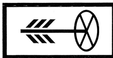
Zusatztafel «Militärische Strassenbenützer gestattet»