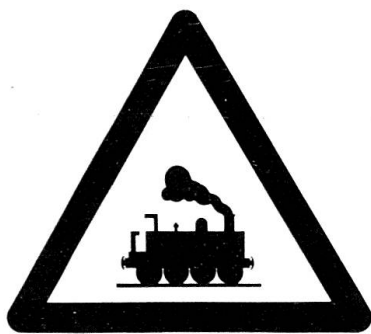
Bahnübergang ohne Schranken