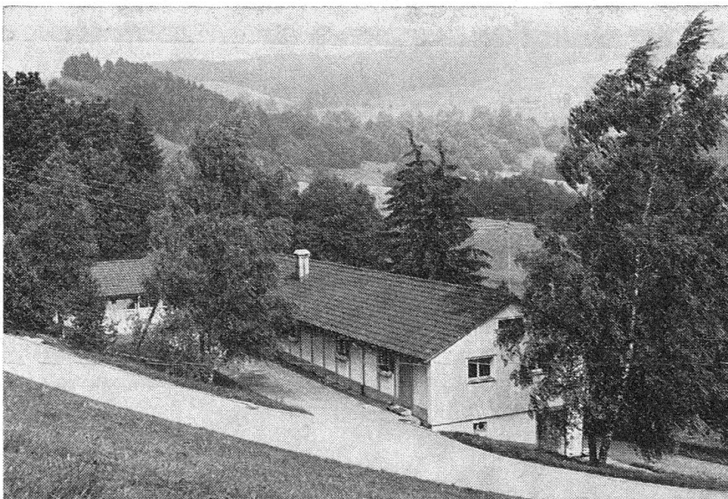
Unterkunftsbaracke für Strafgefangene.