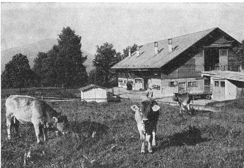
Scheune des Gutsbetriebes.