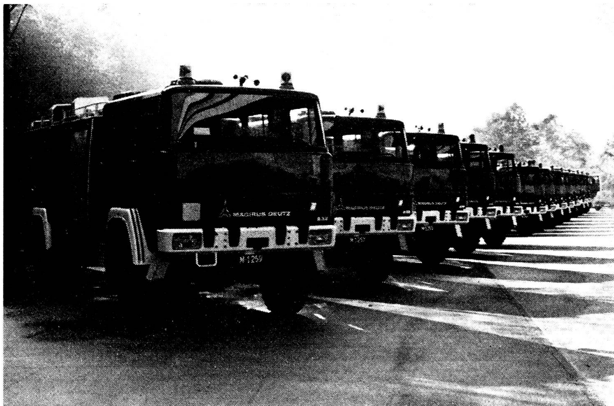
Tanklöschfahrzeuge, Zubringerlöschfahrzeuge, Oelwehrfahrzeuge einiger Versorgungsregimenter

Kenntnis der Gefahren, der Geräte und Einrichtungen und deren Einsatz verringern das Brandrisiko ganz entscheidend.