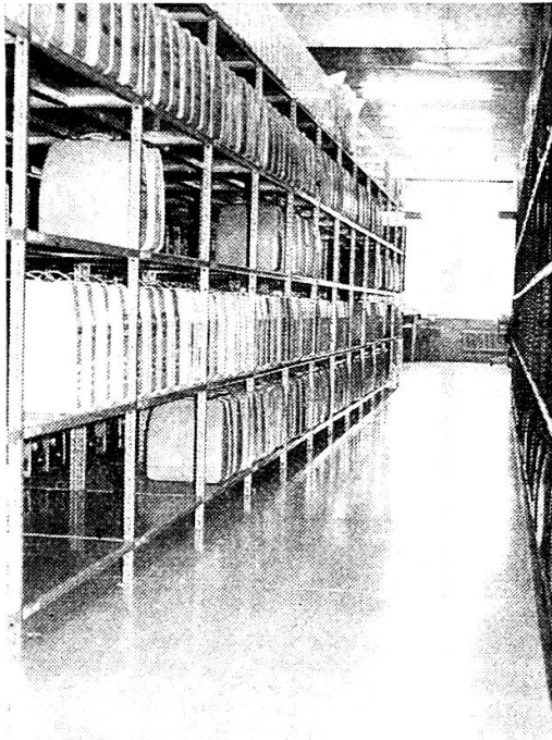
Büromaschinen in Reih und Glied warten auf ihren Einsatz