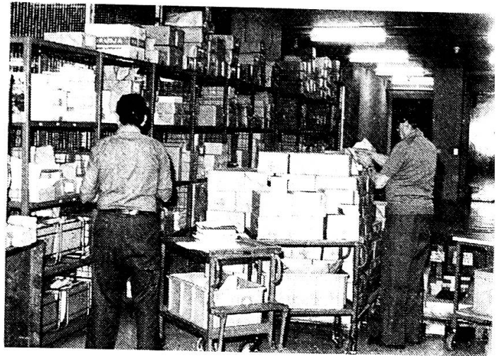
Zum Versand bereit!