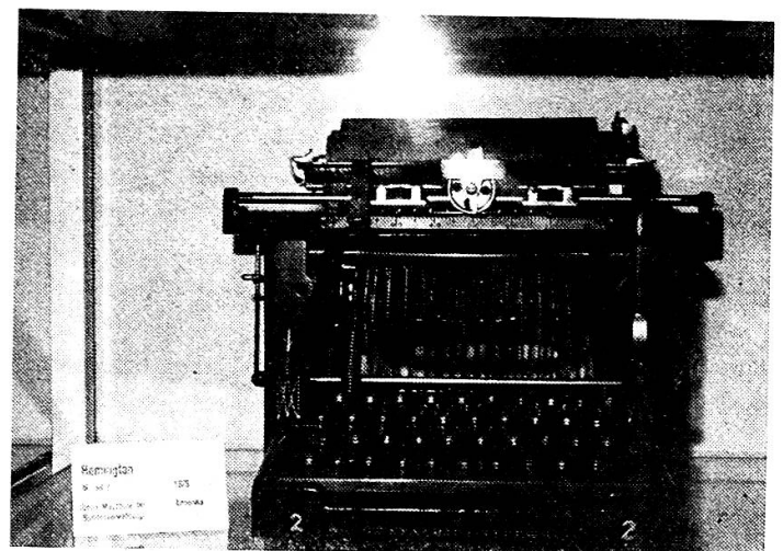
Erste Maschine der Bundesverwaltung (1878) Remington Modell 2