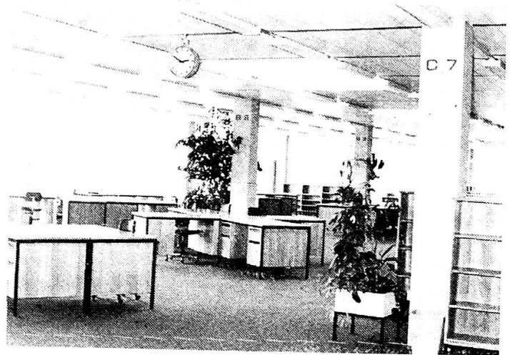
Raum für die Volkszählung (1980)