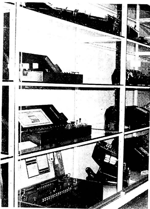
Museum der EDMZ