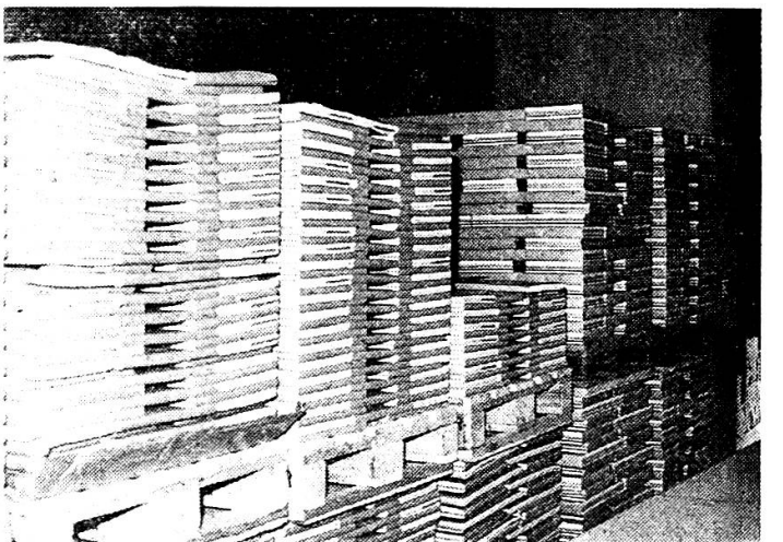
Handlager im Kellergeschoss