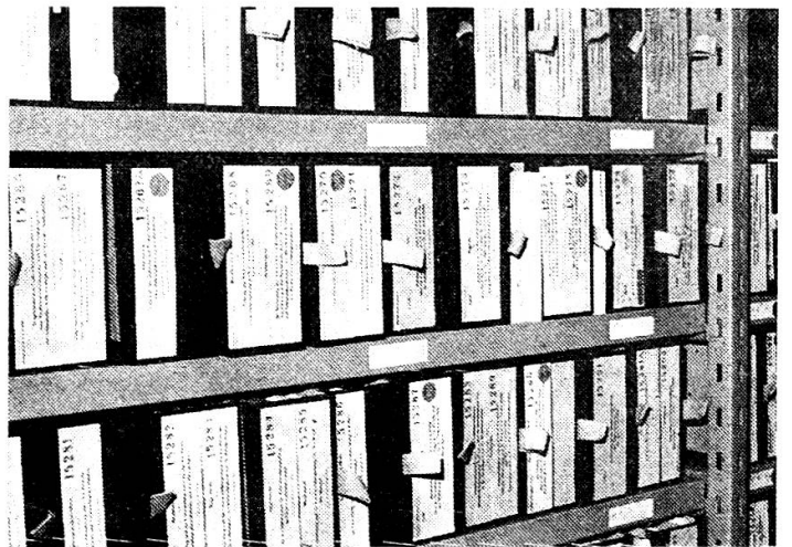
Ein kleiner Teil der 45 000 Bundeserlasse

EIDG. DRUCKSACHEN- UND MATERIALZENTRALE OFFICE CENTRAL FÉDÉRAL DES IMPRIMÉS ET DU MATÉRIEL UFFICIO CENTRALE FEDERALE DEGLI STAMPATI E DEL MATERIALE