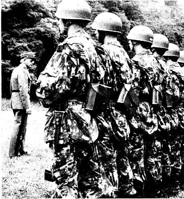
Inspektion durch den Schulkommandanten