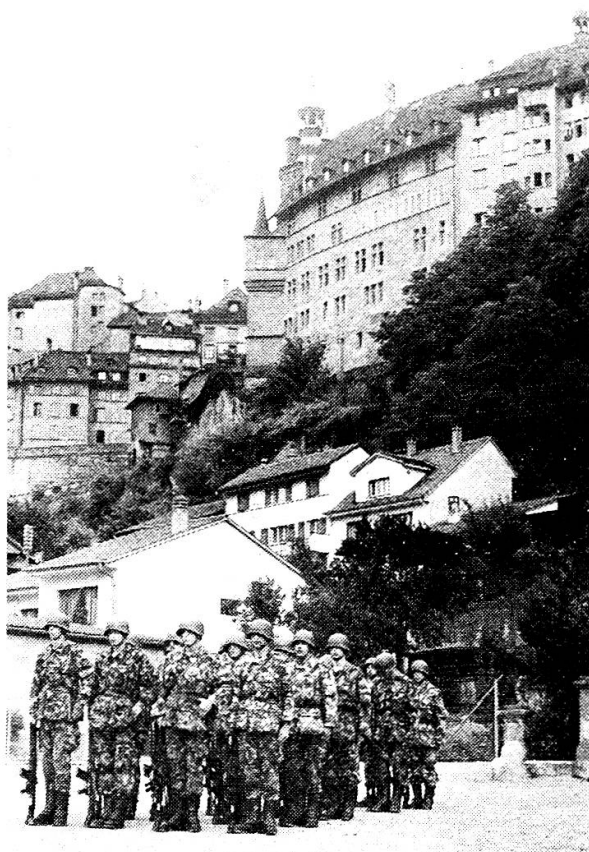
Historische Umgebung prägt!