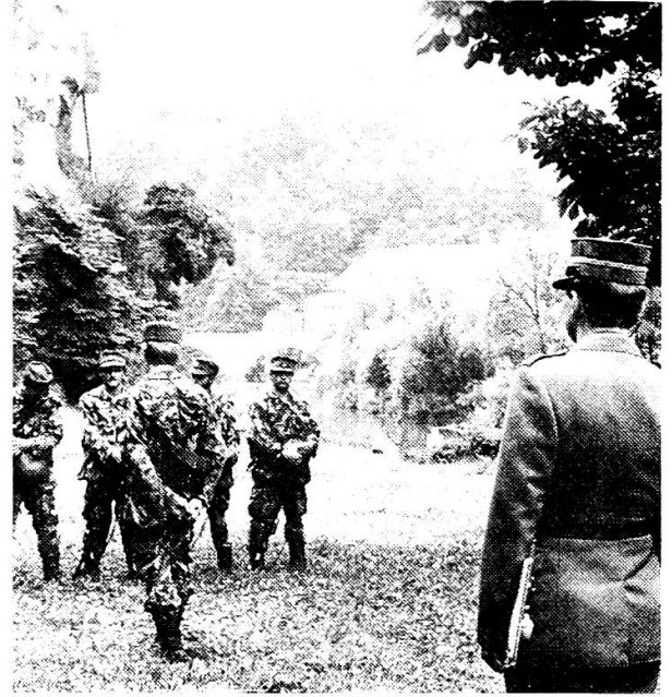
Reizvolle Umgebung des Waffenplatzes Fribourg

Während meines Besuches fand eine Inspektion durch den Schulkommandanten statt am Ende der Unteroffiziersschule. Der vermittelte Stoff, das persönliche Engagement der Instruktoeren, der bestimmte — aber freundliche Ton fallen positiv auf. Diese angehenden Unteroffiziere, die natürlich bereits jetzt seit Wochen im praktischen Einsatz stehen, zeigten gute Fachkenntnisse und ein erstaunliches Geschick, Ihre Kenntnisse «an den Mann» zu bringen.