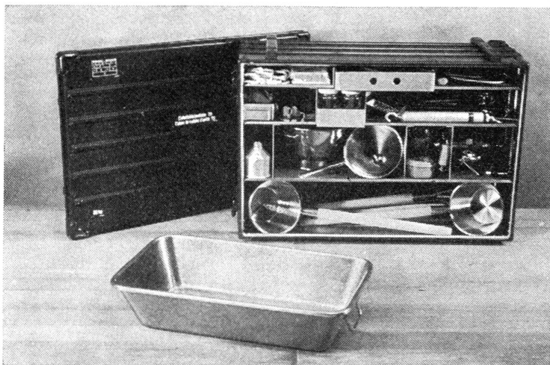
Neue Einheitsküchenkiste wird durchwegs begrüsst

Ich bin natürlich über diesen Entscheid sehr enttäuscht, besonders, weil ich mich für die Wegwerfmützen im WK eingesetzt habe. Trotz positivem Verlauf der Versuche scheidet nun eine Beschaffung am finanziellen Aufwand (Oberstlt P. Creux, Zentralpräsident der Schweizerischen Offiziersgesellschaft der Versorgungstruppen). Ich kann nur hoffen, dass sich die Lage unserer Bundesfinanzen rasch verbessert und in absehbarer Zeit unser Begehren, eine hygienische Kopfbedeckung für das Küchenpersonal zu beschaffen, verwirklicht werden kann. In der Zwischenzeit werden wir uns mit «ad-hoc» Lösungen begnügen müssen.