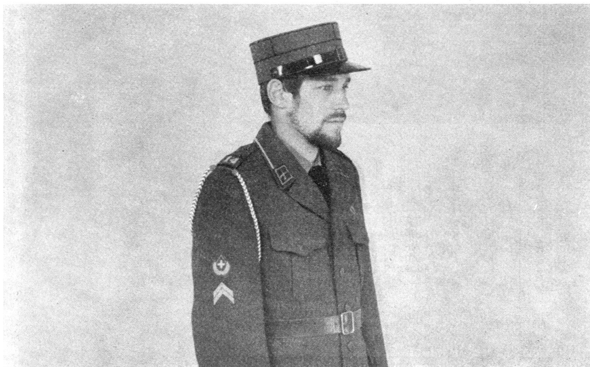
Feldweibel in Ausgangs-Uniform

In verdankenswerter Weise haben zuständige Instanzen des OKK, vorab Fräulein Dreyer, in kürzester Zeit entsprechende Unterlagen gesammelt und vom Armeefilm-dienst Fotos anfertigen lassen. Das, was der bärtige Feldweibel also im Bild zeigt, gilt in Zukunft auch für Fouriere. Einschränkend ist darauf hinzuweisen, dass in allen Artikeln vom Einheitsfourier (Rechnungsführer) gesprochen wird.