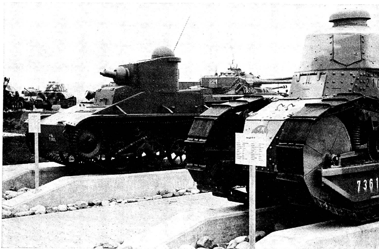
Alttester Panzer im Panzermuseum in Thun: Renault FT 17 (2 Mann Besatzung, 40 PS, 8 km/h, Schweiz)

Im Spätsommer treffen auch zwei Versuchspanzer des amerikanischen Typs M 1 Abrams ein. Vergleichende Versuche zwischen dem deutschen und dem amerikanischen Kampfpanzer ab Herbst dieses Jahres sollen zeigen, welcher der beiden Konkurrenten die Anforderungen der Schweizer Armee am besten erfüllen könnte.