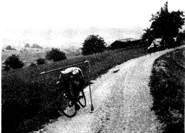
Die Radkünstler auf der Hindernisstrecke

Triathlon ist «in». Die Idee musste somit nur noch umgesetzt und unseren militärischen Anforderungen angepasst werden. Zu absolvieren waren ein anspruchsvoller Veloparcours, eine Joggingstrecke sowie einige Längen im Schwimmbassin. Dazwischen, quasi als Auflockerung, fachtechnische Fragen und eine Schiessübung. Bei schönem Wetter nahmen die Zweierpatrouillen beim Schwimmbad Frick ihr Rad in Empfang, auf welchem sie über zwei nahrhafte Steigungen den Flugplatz in Schupfart zu erreichen hatten. Damit auch das Kartenlesen geübt werden konnte, wurde die Strecke nicht markiert. Daraus ergab sich, dass die eine oder andere Patrouille eine Zusatzschleife einlegte, was sich entsprechend in den Nettolaufzeiten niederschlug. Auf der Schupfarterhöhe war die erste zusätzliche Einlage zu absolvieren.