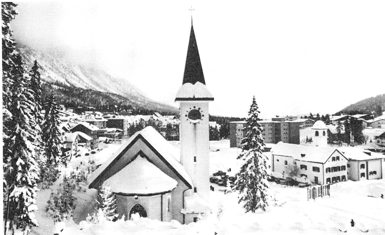
Der Tagungsort Lenzerheide-Valbella im Winterkleid.

Sehr geehrte Gäste Geschätzte Offiziere Liebe Kameradinnen und Kameraden