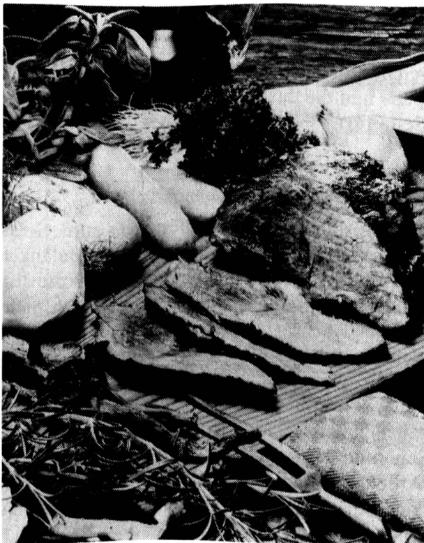
Stufato, ein Schmorbraten nach Tessiner Art

An sich kam die veränderte Marktlage beim grossen Schlachtvieh nicht ganz unerwartet. Die Auswirkungen auf die Schlachtviehpreise überraschten aber selbst Fachleute. Die stark rückgängige Rind- und Kalbfleischproduktion im vergangenen Jahr (-10% gegenüber 1987) bescherte den Bauern noch erfreulich hohe Schlachtviehpreise. Dieser Umstand dürfte wohl eine grössere Zahl von Landwirten dazu verleitet haben, ihre nicht für die Milchviehhaltung bestimmten Kälber über längere Zeit hinweg zu hegen und zu pflegen und anstatt Kalbeben Rindfleisch zu produzieren. Die ausgezeichnete Futtersversorgung im vergangenen Jahr und nun auch während den Wintermonaten dürfte bei diesem Entscheid ebenfalls mitgespielt haben.