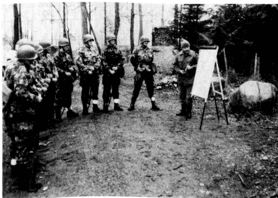
Besprechung einer Kochplatz-Verteidigung

Die Küchenchefschüler werden bereits in der UOS für das Kochen mit Dampfdruckgeräten ausgebildet. Dies eigentlich eher im Hinblick auf das Abverdienen in Küchen auf Waffenplätzen. In der Küche 6 der Mannschaftskaserne in Thun sind alle möglichen Typen, welche in den Waffenplatzküchen installiert sein könnten, in Reihe montiert und betriebsbereit. Darin findet auch ein grosser Teil der Ausbildung statt. Somit ist jeder Absolvent in der Lage, sich beim