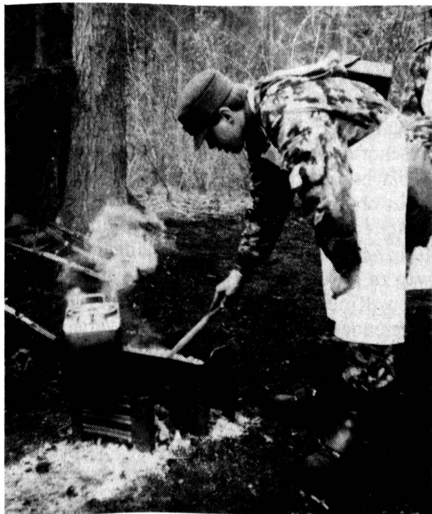
Verpflegungszubereitung im Gelände

Auch diesem Bereich wird in der Küchenchefschule grosse Aufmerksamkeit geschenkt. So fördert man das Preisbewusstsein des Küchenchefs. Bekanntlich ist der Fourier – gemäss unseren militärischen Reglementen – für den Einkauf verantwortlich; er ist für die Preiskalkulation zuständig. Nun, wenn der Küchenchef nicht mitdenkt und das Preis-Leistungs-Verhältnis nicht mittragen hilft, nützt die beste Planung des Fouriers nichts. Der angehende Küchenchef wird dahin geführt, dass er (wieder) lernt, welche Produkte zu welcher Jahreszeit günstig und der Tradition entsprechend erhältlich sind.