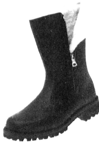
Modell D: Allround-Stiefel mit starker Profil-Gummisohle, Fr. 179.—. Rindleder schwarz, Fussbetteinlage auswechselbar, Metallreissverschluss, mit Lammfellfutter, Grösse 39–46. mit Lederfutter Fr. 169.—.