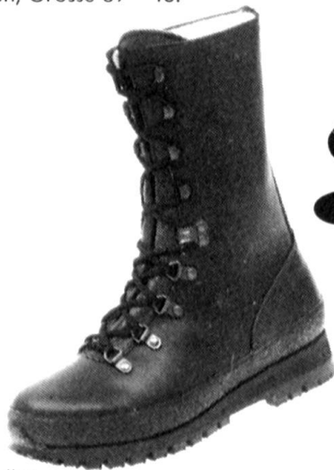
Modell B: De Luxe mit Trekking-Sohle, Fr. 169.—. Rindle- der schwarz, Fussbetteinlage auswechselbar, Lederfutter, Schnellschnürverschluss, leicht im Tragen, Grösse 36–48.