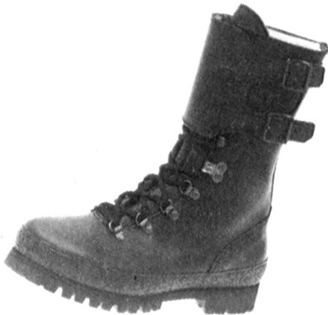
Modell A: Kampfstiefel mit starker Profil-Gummisohle, Fr. 169.—. Rindleder schwarz, Fussbetteinlage auswechselbar, Lederfutter, Schnellschnür- verschluss, angenähte Gamasche, leicht im Tragen, Grösse 39–48.