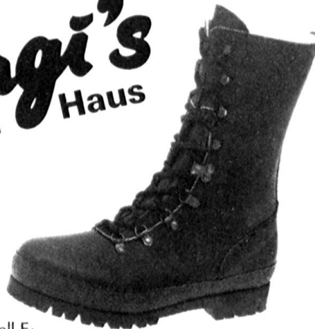
Modell E: De Luxe mit starker Profil-Gummisohle, Fr. 169.—. Rindleder schwarz, Fussbetteinlage auswechselbar, Lederfutter, Schnellschnür- verschluss, leicht im Tragen, Grösse 39–46.