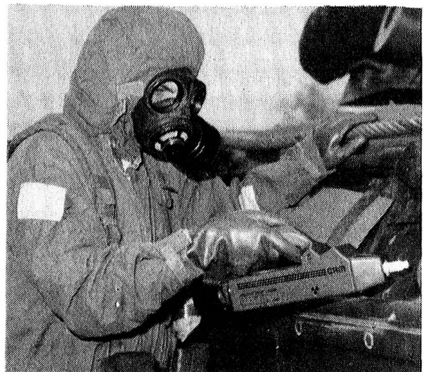
. . . und Reparatur unter Gasschutz.

Für die Herstellung und Unterhaltung der Fernmeldeverbindungen zeichnen die Funker und Nachrichtenleute verantwortlich.