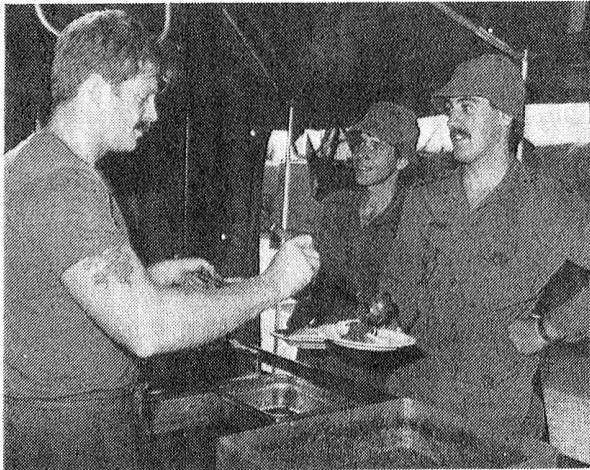
Die Verpflegungsausgabe im Feld . . .

stand. Die damals gewonnenen Erfahrungen wurden armeeweit übernommen, und 1968 begann man die Versorgung der damals noch in Norddeutschland stationierten Brigade neu zu organisieren. Am 15. Mai 1968 wurden verschiedene Formationen zusammengeführt. Aus der 1. Transportkompanie und Teilen der 4. Instandsetzungseinheit entstand die Nachschub- und Transportkompanie. Sie setzte sich aus vier Transportzügen, einen Versorgungszug, einen Instandsetzungszug und ein Verpflegungsdepot zusammen, insgesamt 359 Soldaten aller Dienstgrade.