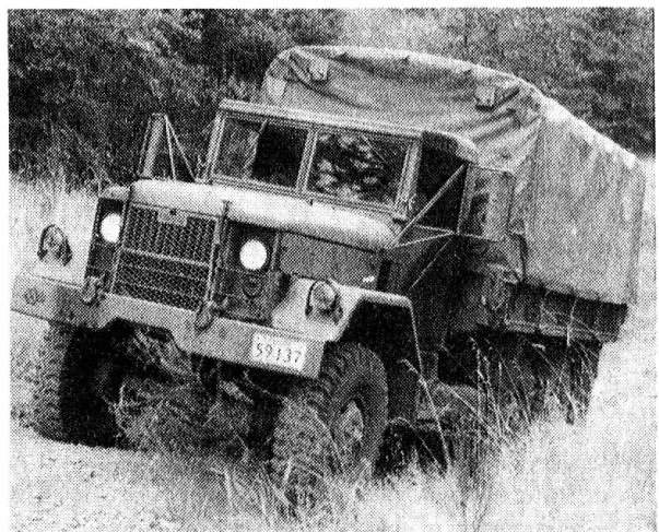
Moderne Lastwagen transportieren den Nachschub.

Ein weiterer Zug mit 56 Soldaten in drei Gruppen ist mit Wartungs- und Reparaturarbeiten an den zunehmend komplizierter werdenden Waffen und elektrischen/optischen Geräten betraut. Die Techniker aus fünf eigenständigen