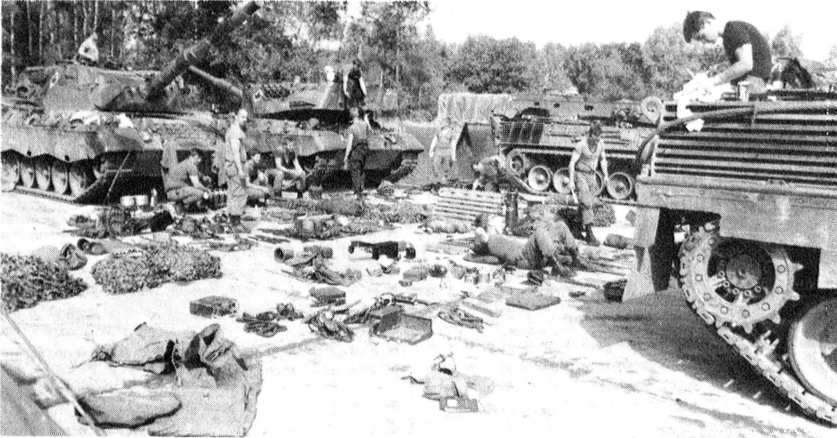
Unser Bild stammt von der kanadischen Armee und zeigt das Drum und Dran bei den Instandsetzungsarbeiten am Kampfpanzer.