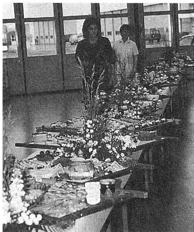
Ein feines Buffet erwartete die Gäste aus aller Welt.

Sie heute feiern können. Lassen Sie uns jetzt darüber reden, was uns die Zukunft bringen wird. Ich hoffe, dass wir unsere Beziehungen durch die Endmontage der Schweizer F/A-18 hier in diesem Werk ausbauen können. Das würde sich in Form von anspruchsvoller, gut bezahlter, technisch hochstehender Arbeit für viele Menschen auszahlen.»