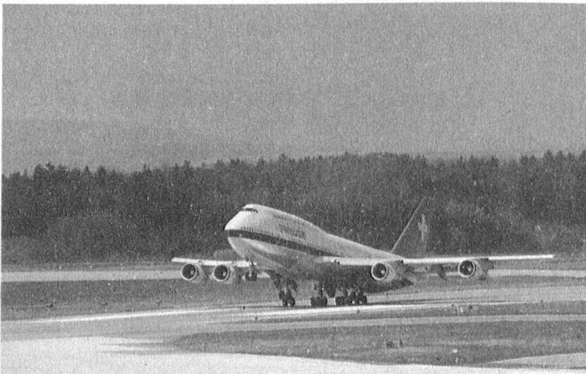
Startender Jumbo-Jet (Flughafen Zürich-Kloten).

Als eine reelle Möglichkeit für den «Markt Europa» könnte sich G. Heuberger ein Projekt ALCAZAR LIGHT vorstellen. Dabei würde man vorläufig von einer Fusion und der Teilnahme der KLM an dieser Allianz absehen. Der interne Widerstand dagegen aus finanziellen Gründen und der externe Druck der Konkurrenz könnten wahrscheinlich auf diese Weise in Grenzen gehalten werden.