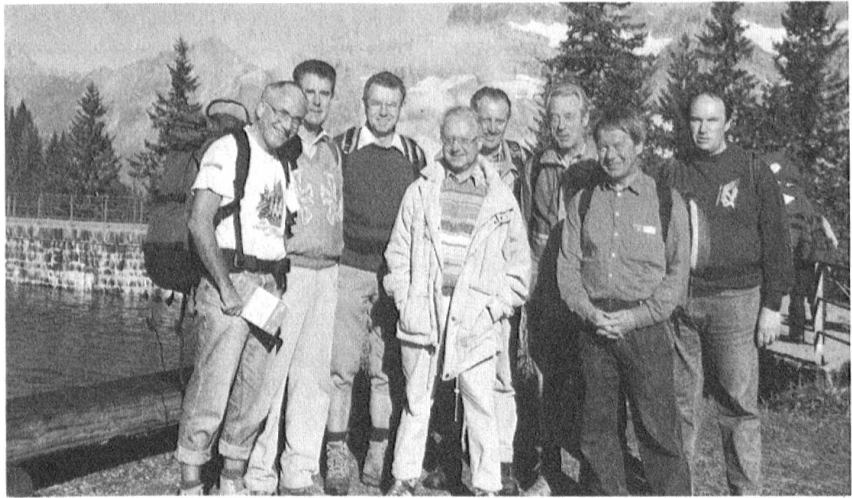
Rast am Stausee Garichti im Mettmengebiet