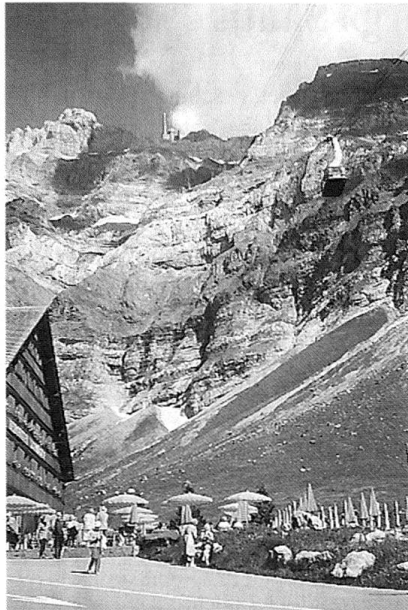
Die Schwägalp mit der Schwebbahn und dem Säntis.