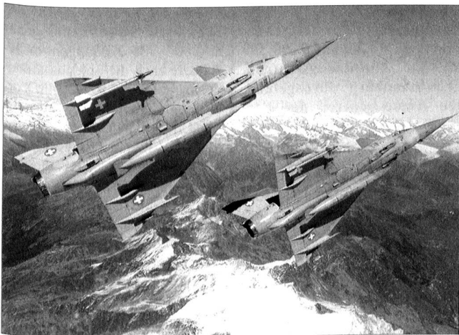
Eine Doppelpatrouille Mirage III im Turtmantal/Brunegg über Gletscher und Barrhorn.