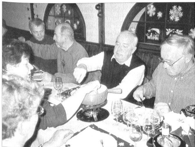
Bei einem guten Fondue mit viel Knoblauch wurde das vergangene Verbandsjahr verabschiedet.