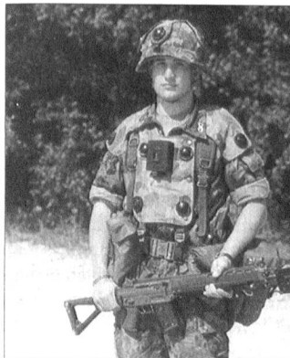
Die Abgabe von Sturmgewehren 90 (unser Bild) erfolgt wie bis anhin nur leihweise. Über eine Abgabe zu Eigentum – in Analogie zum Sturmgewehr 57 – wird erst zu einem späteren Zeitpunkt entschieden.

Das VBS wird demnächst den Grossteil der noch am Lager liegenden Karabiner 31 an die Schweizerische Munitionsunternehmung Thun (ein Unternehmen der RUAG SUISSE) zur Liquidation übergeben. Der Verkauf wird dabei ausschliesslich gemäss den Bestimmungen des Waffengesetzes und der Waffenverordnung erfolgen.