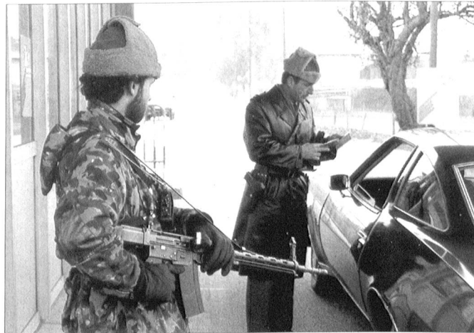
Die Geschäftsleitung VBS hat an ihrer Februarsitzung die Abgaberegulierung für Sturmgewehre 57 (unser Bild) und Karabiner 31 genehmigt.

Unter den 156 neuen SWISSCOY-Angehörigen befinden sich sieben Frauen. Vom ersten Kontingent haben 15 Personen ihren Einsatz um ein weiteres halbes Jahr verlängert. Der rechnerische Überbestand (160) erklärt sich dadurch, dass sowohl das Sicherheitsmodul wie die Militärpolizei je zwei Ablösungen auf einmal ausbilden liessen. Die Ausbildungsschwerpunkte umfassten: Kenntnis des Kosovo, Verhalten gegenüber Minen/Blindgängern, Grundsätze für den Waffeneinsatz / Neue Gefechtsschiess technik, Fahrausbildung, fachspezifische Ausbildung.