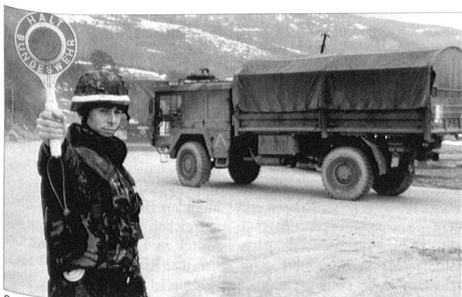
Soldaten eines Transportbataillons fahren Einzel- und Mengenverbrauchsgüter in Kroatien.

Aber noch «ziert» man sich an kompetenter Stelle, obwohl schon längst zum Rückzug geblasen wurde, auch unter Hinweis auf die Veränderungen bei den meisten anderen Streitkräften. Obwohl sich die politischen und gesellschaftlichen Rahmenbedingungen entscheidend veränderten, träumen scheinbar noch manche Politiker und Militärs von längst vergangenen Zeiten. Andere sind knallharte Realisten: Fällt die Wehrpflicht droht die Schliessung von 150 bis 200 Standorten. Fast jede dritte Garnison würde dann aufhören zu existieren. Gerade in strukturschwachen Räumen bietet die Bundeswehr oft den wichtigsten Wirtschaftsfaktor, schafft Arbeitsplätze und Umsatz. Eine Schliessung wäre