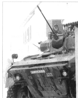
Spähpanzer Luchs. Das Material der KRK-Verbände wird deutlich leichter.