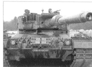
Die Zahl der schweren Panzer wurde erheblich reduziert.

So bleibt primär die Reduzierung der Personalkosten als Ausweg und das führt zu einer drastischen Verkleinerung der Stärken. Die zahlreich vorhandenen, manchmal recht realitätsfremden Pläne der noch zahlreicheren «Exper-