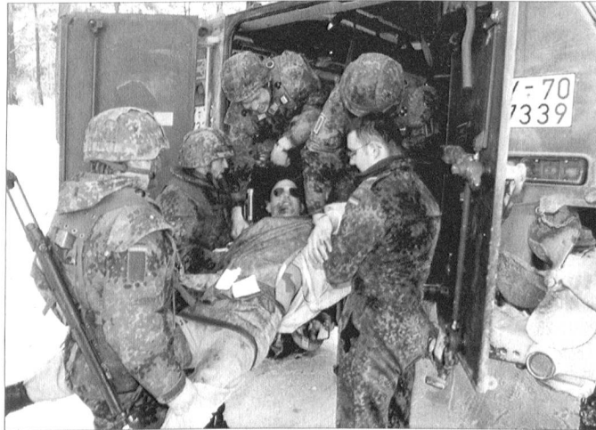
Sanitätsdienstliche Versorgung von Verwundeten gehört zur Pflicht.

Um mit der Neuausrichtung der Streitkräfte auf das erweiterte Aufgabenspektrum schritthalten zu können, ist in diesen Berei-