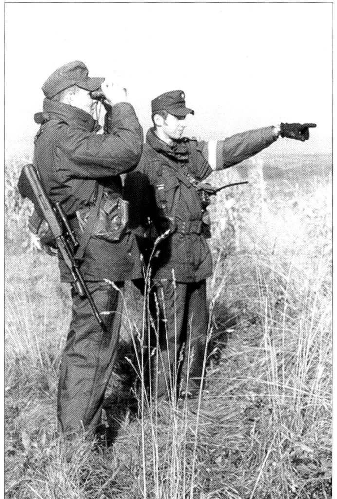
Soldaten des österreichischen Bundesheeres stehen seit 1990 ununterbrochen im Assistenzeinsatz zur Grenzraumüberwachung an der burgenländisch-ungarischen Grenze.