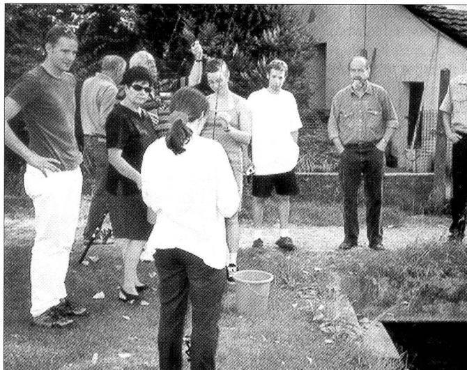
Stetten: 16 Teilnehmer erschienen zum Fischen