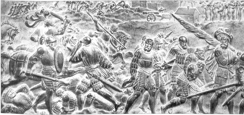
Schlacht bei Marignano, 1515. Marmorrelief vom Grabmal König Franz I. von Frankreich. Der Rückzug der Eidgenossen, Fahnen und Verwundete in der Mitte.