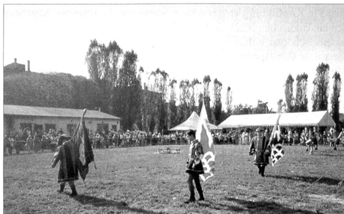
Historisches Schauspiel. Fahnenräger und Trommler.

Im Kalten Krieg profilierte sich die Schweiz, zwischen den Blöcken stehend, als Vermittlerin von «Guten Diensten». Die schweizerische Neutralitätspolitik war geprägt von der Devise