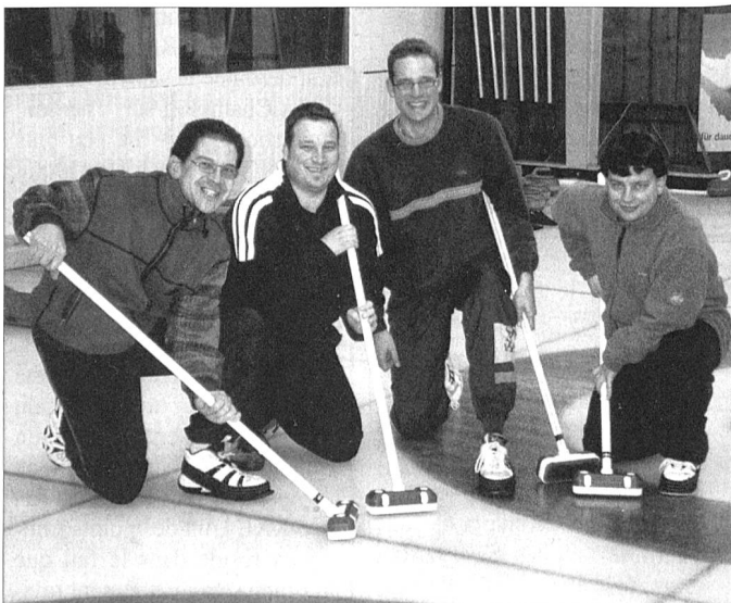
Das «C-Team», nämlich die beiden Christians E. S. und H. sowie die beiden Christophs K. und E.

Da im Haus der Kantonspolizei erhöhte Sicherheitsbestimmungen gelten, ist eine Anmeldung bis 31. März unter Angabe von Name, Vorname, Geburtsdatum, Adresse und Wohnort notwendig.