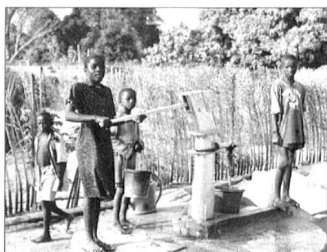
Les élèves pompent l'eau pour remplir les bidons.