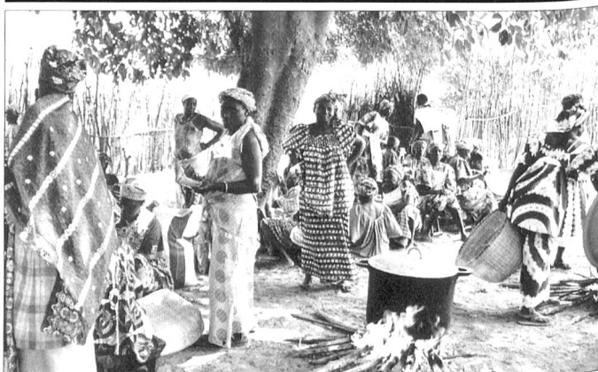
Les femmes du village préparent le repas pour les vacanciers de l'hôtel.

Depuis l'automne 1998, les services de renseignement américains produisent des émissions de propagande à destination de l'Irak et l'Iran. A l'instar de Radio Free Irak, Radio Liberty est aussi une structure à but non lucratif financée par le Congrès américain qui a été créée au début des années 1950, en pleine guerre froide. La station qui émettait à ses débuts depuis Munich en Allemagne a été transférée en 1995 à Prague.