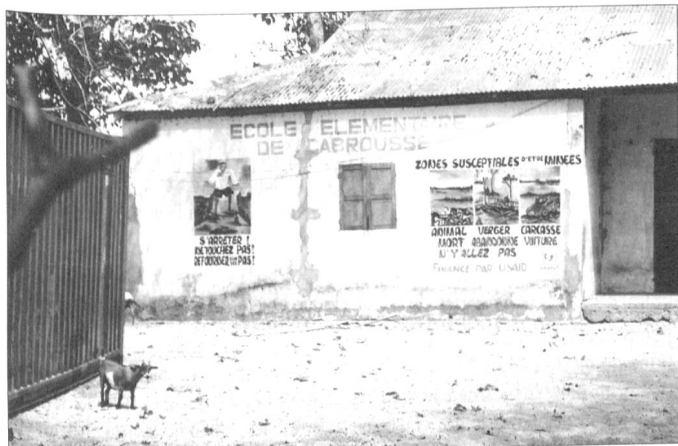
Le bureau du Directeur à l'extrémité des classes, à gauche un container servant de cantine.

veaux, m'ont immédiatement reconnu. Après avoir discuté quelques instants dans le préau, l'un d'entre eux m'a conduit à la bibliothèque où travaille l'épouse du Sous-préfet qui est enseignante à mi-temps et responsable de la bibliothèque pour l'autre mi-temps.