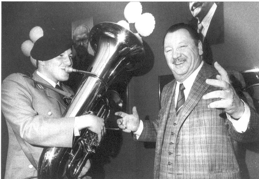
Mit Musik geht alles besser ...