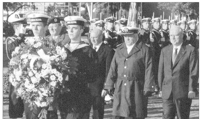
Ehrung der Gefallenen der polnischen Seestreitkräfte.

Sicherheits-, Verteidigungs- und Militärpolitik des veranstaltenden Landes und andererseits über den diesbezüglichen Stand in den Staaten der Teilnehmer orientiert. Mit grosser Überzeugung legten die Vertreter des polnischen Verteidigungsministeriums den seit dem Beitritt zur NATO (1999) anhaltenden Wandel ihrer Streitkräfte dar. Dabei war der unmittelbare Einfluss der USA unübersehbar, der auch in der Beschaffung von 48 amerikanischen F-16 «Fighting Falcon» Kampfflugzeugen zum Ausdruck kommt. Jedenfalls nimmt Polen seine äussere und innere Sicherheit sehr ernst und bereitet sich auf den künftigen Schutz der EU-Aussengrenze bestmöglichst vor.