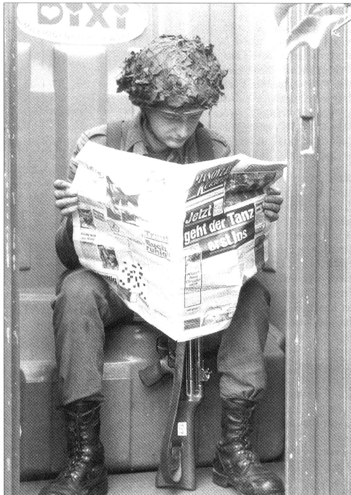
«Sitzung» (mit Waffe) auf geleaster Bundeswehr-Toilette.

Auch die Erwartungen in die Privatisierung des Fuhrparks haben sich nach einigen Anfängererfolgen nicht erfüllt. Daher sollen viele Umstrukturierungsaufgaben wieder auf die Truppe «rückübertragen» werden. Angeblich hat die Fuhrparkfirma einen zweistelligen Millionenbetrag zweckwidrig verwendet. Untersuchungen laufen. Die geplanten Einsparungen von einer Milliarde Euro in den nächsten zehn Jahre erscheinen unrealistisch.