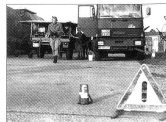
«Vorsicht!» Wie lange bleibt die Bundeswehr noch fahrbereit!

Scheinbar ist es heute üblich, «Geschäftsfreunden» lukrative Aufträge zuzuschanden, Arbeit zu verteilen und wohl vor allem Verantwortung abzuwälzen. Die Bundeswehr verfügt über Tausende Offiziere, die sich auf Kosten des Steuerzahlers auch moderne Betriebswirtschaftslehre, Volkswirtschaft oder Management-Wissen erwerben. Warum werden diese hochqualifizierten Fachleute, die sich in einigen Praktikanten-Jahren in der freien Wirtschaft auch praktische Kenntnisse aneignen könnten, nicht auf diesen Personenkreis übertragen? Umsonst studiert? Oder: «Ran an den Handkurbelwagen!»