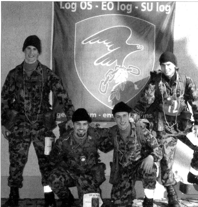
Die Kaderschulen der Schweizer Armee verlangen den Anwärtern einiges ab.

den. Die Logistikkoffiziersschule des Lehrverbandes Logistik 2