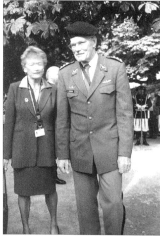
Von Seiten der Armee beehrte der Chef der Armee KKdt Christophe Keckeis mit Gattin die Feierlichkeiten.

Die Schweizergarde beansprucht eine stärkere Rolle beim Schutz des Papstes. Der Kommandant Elmar Theodor Mäder beklagt, dass die Gendarmerie immer mehr die Führung übernehme, vor allem wenn Papst Benedikt XVI. den Vatikan verlasse und Ferien mache oder in Rom eine Kirche besuche. Daher habe Mäder nach der Mailänder Zeitung «Corriere della Sera» eine Art Petition eingereicht, in der er wieder den Primat für die Schweizergarde fordert. Im Kern beklage er die Tendenz, dass die Gardisten immer mehr zur Stafflage würden und nur noch an den Eingängen des Vatikans stünden und von Touristen fotografiert würden. Dabei gebe es ein Gerangel um die Rolle der 1970 offiziell aufgelösten päpstlichen Gendarmerie, deren Aufgaben heute faktisch staatliche Carabinieri übernommen hätten. Tatsächlich hat sich die Rolle der Garde verändert, nicht zuletzt wegen der Terrorgefahr. So wachen etwa staatliche Polizisten in Uniform und in Zivil auf dem Petersplatz, und bei der jüngsten Reise von Papst Benedikt XVI. nach Köln waren lediglich zwei Gardisten dabei, allerdings in Zivil.