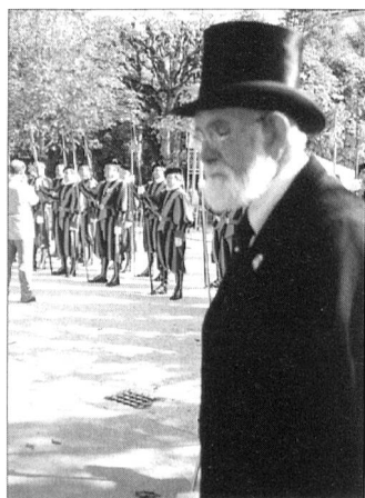
Die Feierlichkeiten 500 Jahre GSP – Guardia Svizzera Pontificia dauern noch bis Winter 2006.

Überdies: Für einmal weckte ein «militärischer Anlass» das Interesse