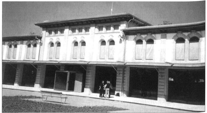
Die EMB will auch künftig am neuen Standort ihren Kunden bestmöglichst dienen und einen substanziellen Beitrag an die Weiterbildung von Armeeingehörigen und auch Privatpersonen leisten.

Insbesondere in einer Milizarmee mit ihren kurzen Dienstzeiten kommt der Ausbildung eine entscheidende Bedeutung zu. Die Milizkader, aber auch die Berufskader der Armee, sind ständig gefordert und befinden sich in einem permanenten Lernprozess; wer sich frühzeitig mit den möglichen Problemen beschäftigt, kann in unvorhergesehenen Situationen lagegerecht reagieren.