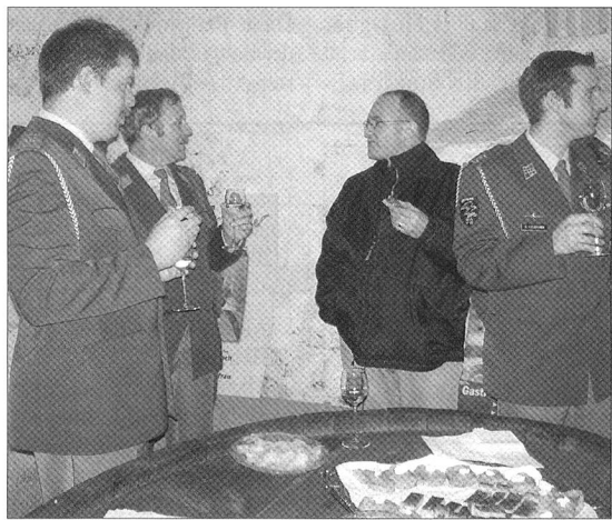
Vor dem Hauptgang «Suure Mocke» kredenzteten die Teilnehmer der Hauptversammlung einen feinen Tropfen und genossen die zahlreich vorhandenen Häppchen.