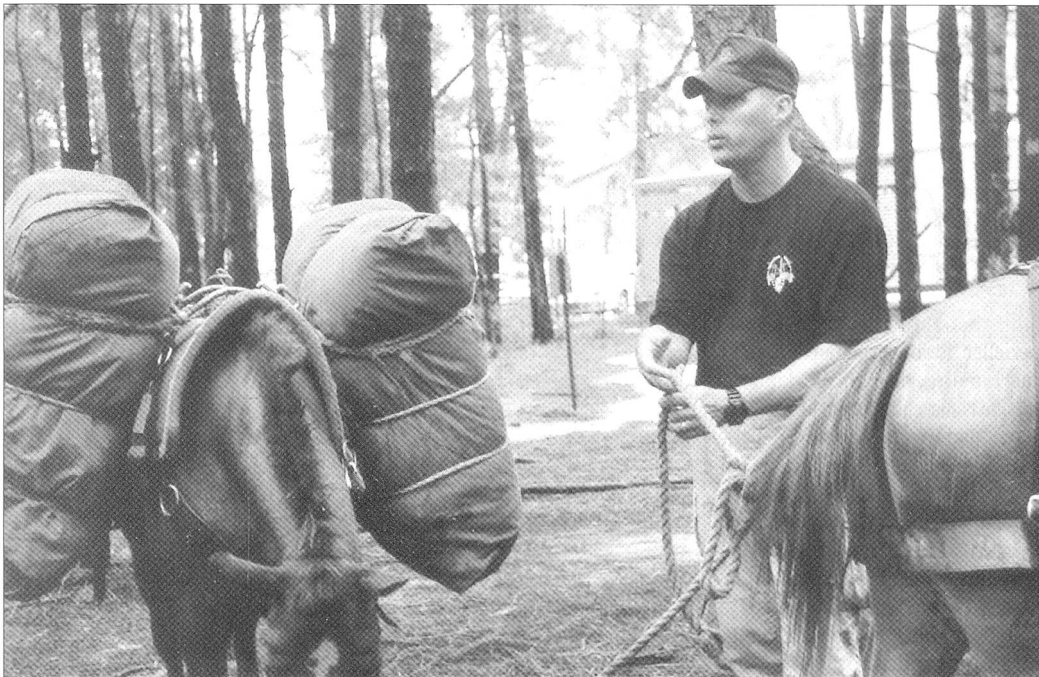
Die US Army hat Pferde und Tragtiere wieder entdeckt.

Spätestens seit dem 11. September 2001 stehen die amerikanischen Special Forces als alleinige nennenswerten Anti-Terror-Experten im Kampf gegen den Terrorismus ganz vorne. Wahre Wunder sollen sie vollbringen, wo Politik und die herkömmlichen militärischen Kräfte versagen.