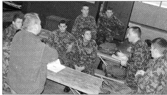
Die zum Teil einschneidenden Änderungen im Kommissariatsdienst erfordern eine vertiefte Aus- und Weiterbildung.