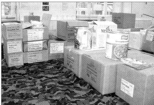
Im Jahr 2008 gibts auch verschiedene Änderungen im Angebot des Armeeprovianten.

Lesen Sie bitte weiter auf den Seiten 4 bis 6