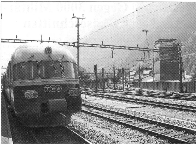
Erstfeld: Auch der legendäre RAe 1053 ist bereit zur Fahrt über den Berg.