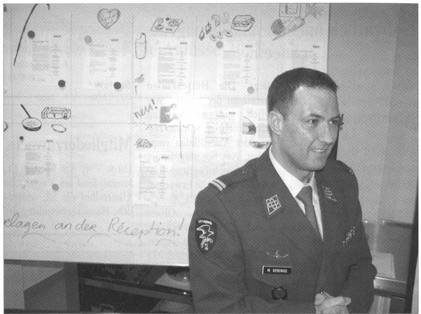
Am vorletzten November holte sich die Nationalmannschaft der Schweizer Militärköche den verdienten Weltmeistertitel. Am letzten Dezember tagte das SACT-Team zusammen mit den Sponsoren zum alljährlichen Debriefing in Gümligen. Mehr darüber auf Seite 24 in dieser Ausgabe von ARMEE-LOGISTIK.

Die Resolution 1244 des UNO-Sicherheitsrates vom 10. Juni 1999 bleibt ohne gegenteiligen Beschluss des UNO-Sicherheitsrats auch nach einer möglichen