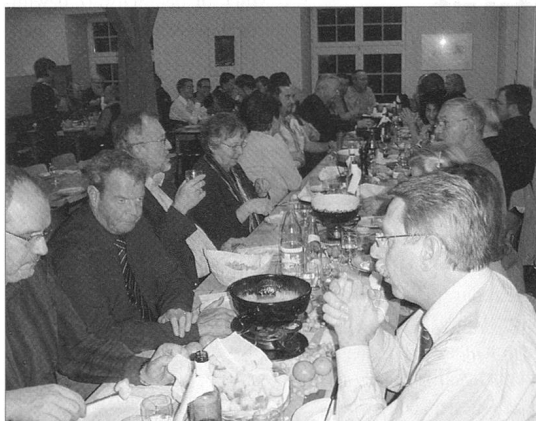
Blick in die gemütliche Runde.