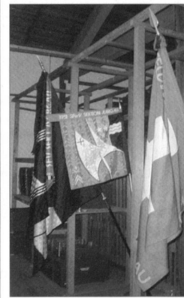
Ein würdiger Platz für die Feldzeichen wurde gefunden.

Wahrlich, einen besseren Spruch zur Auflösung der beiden Sektionen gibt es nicht!