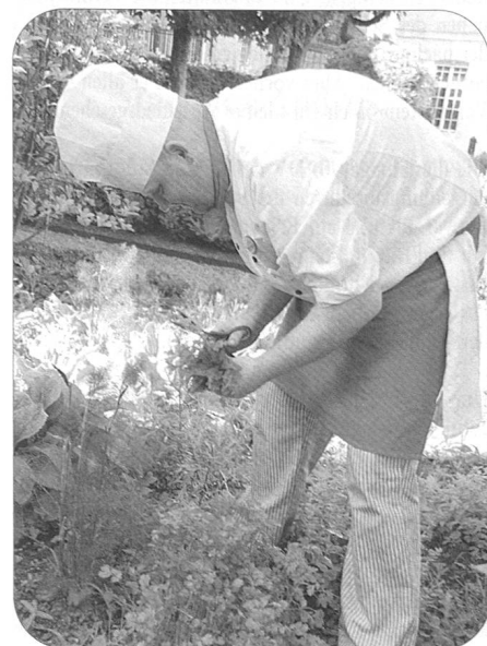
Das Bankett wurde mit Gartenkräutern aus dem Garten vor der Haustür zubereitet.

Nach dem Apéritif direkt an der Aare und bei herrlichem Sonnenschein genossen die Teilnehmer ein bestechendes Bankett mit Unterhaltung.