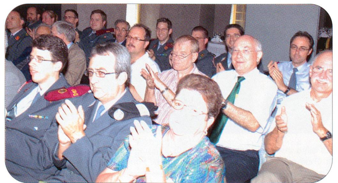
Freudenstimmung herrschte während des ganzen Tages vor, während und nach der Delegiertenversammlung.