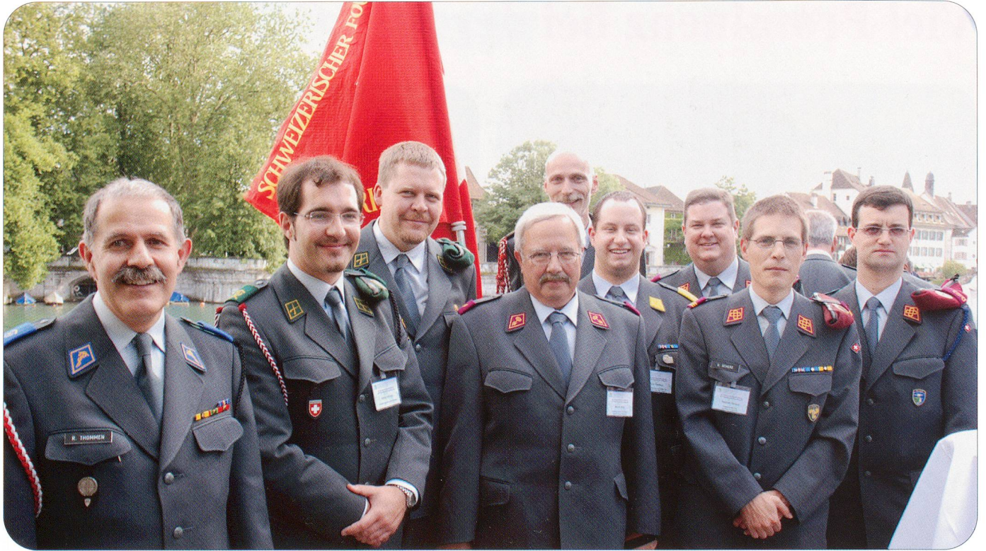
Die künftigen Geschicke des Schweizerischen Fourierverbandes (SFV) liegen in den Händen dieser Herren.