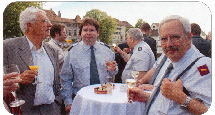
Diese fünf Fouriere der Sektion Bern sorgten für einen reibungslosen Ablauf der Jubiläumsdelegiertenversammlung in Solothurn (links) und ein Teil der Delegierten aus der Romandie genoss offensichtlich den Sonnenschein (rechts).