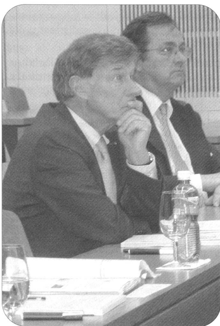
Gerold Bührer, Präsident von economiesuisse, ist erstaunt und zollt der Armee Hochachtung über die Dienstleistungen der Höheren Kaderausbildung – auch für die in- und ausländische Wirtschaft.

Die Führungsausbildung der Armee im Massstab 1:1 erleben und ihren Mehrwert für die Wirtschaft erkennen: Unter dieser Zielsetzung trafen sich heute in Luzern rund 21 Exponenten von Schweizer Dach- und Fachverbänden der Wirtschaft mit hochrangigen Armeevertretern. Sie besuchten an der Höheren Kaderausbildung der Armee (HKA) einen Lehrgang angehender Mitarbeiter in Bataillons- und Abteilungsstäben. Der Anlass ist eine Massnahme der Armeeführung zur Intensivierung des Dialogs der Armee mit wichtigen Anspruchsgruppen aus der Schweizer Gesellschaft.