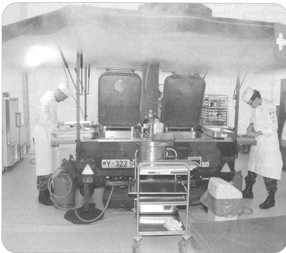
Zweimal mussten die Militärköche «unter Feldbedingungen» an den Herd. Zunächst war ein Drei-Gang-Menü für 150 Personen auf einer Feldküche der Nato zu zubereiten.