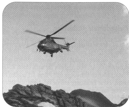
Super Puma auf dem Anflug auf die Ebenfluh (Axalp).

Der rasante globale Bevölkerungszuwachs vergrössert die Reibungsflächen. Bewaffnete Konflikte, Katastrophen, Unruhen und militärische Aggressionen führen zu Krisen, Migrationen, Terrorismus und Krieg. Sie sind ernst zu nehmende Bedrohungen und Gefahren, auch für die Schweiz. Die Luftwaffe übernimmt einen wichtigen Teil deren Erkennung und Bekämpfung: Sie sichert die Lufthoheit, leistet Katastrophenhilfe, überwacht den zivilen Luftraum (circa 3000 Flugbewegungen im Tag), hilft bei Navigations- und Funkproblemen, erfasst und überprüft unangemeldete Überflüge.