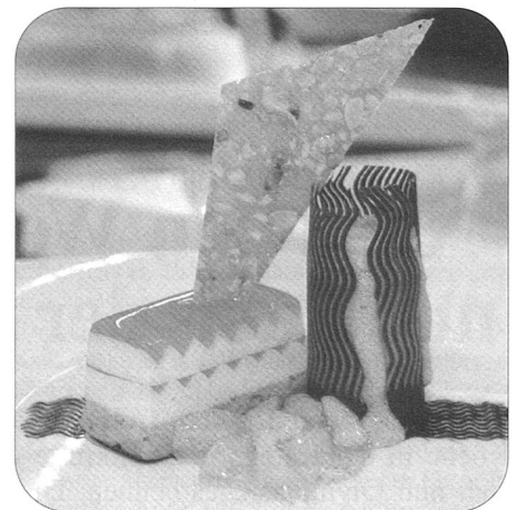
Wahre Kunstwerke präsentierte unsere Nationalmannschaft der Schweizer Militärköche in Erfurt.