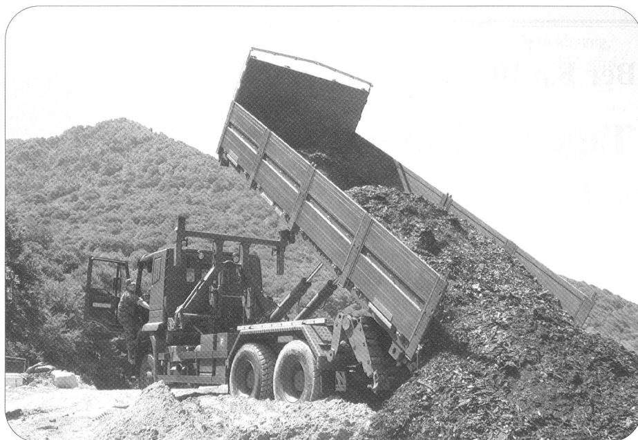
Transport von Gütern jeder Art – ob lose oder palettiert. Die Mob Log Ber Kp 104 verfügt über Transportmittel für die verschiedenen Einsätze.

den daher Informationen weitergegeben, Probleme in Bezug auf die Logistik und das Personal besprochen und die Einsätze der nächsten Tage abgestimmt. Zudem findet die Befehlausgabe für einen Verkehrseinsatz zu Gunsten des Panzerbataillons 13 statt. Die Spezialisten des Verkehrszuges werden das Bataillon auf einer einwöchigen Übung im Raum Zürcher Oberland begleiten. Sie stellen dabei sicher, dass die mechanisierten Verbände ihr Ziel möglichst reibungslos erreichen und dabei militärische und zivile Verkehrsteilnehmer aneinander vorbeikommen. Dazu wird jede Strecke erkundet, eine temporäre Wegweisung erstellt, der Konvoi mit Motorrädern begleitet und an wichtigen Knotenpunkten der Verkehr geregelt.