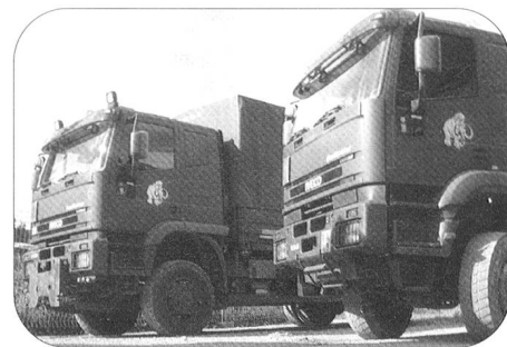
Die Fahrzeuge mit dem Mammut-Logo – unterwegs auf Schweizer Strassen oder hier im Fuhrpark der Mob Log Ber Kp 104.

Stalden im Emmental, 0830 Uhr. Am Standort der Mob Log Ber Kp 104-1 geht der Auftrag in der Transportzentrale ein. Oberleutnant Martin Geisser ist Zugführer des Durchdiener-Transportzuges und damit auch zuständig für die Transporteinsätze. Er prüft den Auftrag, entscheidet, welche Motorfahrer seines Zuges und welche Fahrzeuge aus dem grossen Fuhrpark der Kompanie eingesetzt werden und nimmt den Befehl in die Planung für den übernächsten Tag auf.