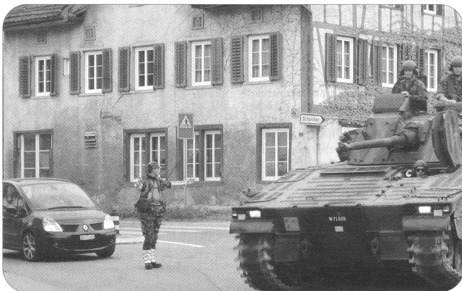
Panzerverschiebungen zu Gunsten von Schulen oder WK Verbänden sind die Hauptaufgabe des Verkehrszuges der Mob Log Ber Kp 104.

Lead: Die Logistikbrigade 1 (Log Br 1) verfügt mit den Durchdienern der Mobilien Logistik-Bereitschaftskompanie 104 (Mob Log Ber Kp 104) über ein Mittel der ersten Stunde. Die Kompanie besteht aus je einem Nachschub-, einem Transport- und einem Verkehrszug. Die Durchdiener stehen der Logistikbasis der Armee (LBA) im Bereich des Nachschubs und der Transporte sowie mechanisierten Verbänden bei deren Verschiebung zur Verfügung.