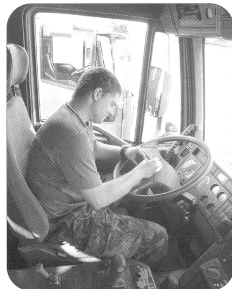
Zur Vorbereitung der Fahrt gehört auch das Ausfüllen der Scheibe des Tachographen.

Text und Bilder: Maj i Gst Dominik Winter, ZSO Kdt Log Br 1 / Chef Mob Log Ber Kompanien 104