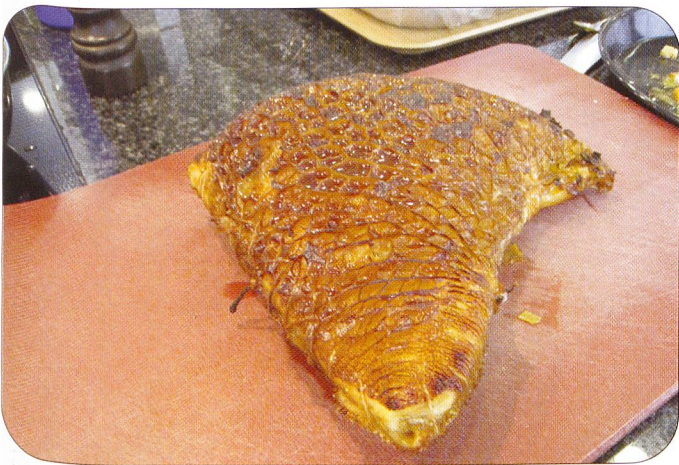
Dieses Dreigangmenü schlug wie eine Bombe ein – ein kulinarischer Leckerbissen.