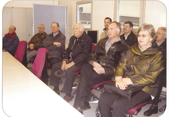
Bevor es weitergeht, noch ein Gruppenbild, während die andere Gruppe im Theoriesaal interessiert den Ausführungen zuhörte.