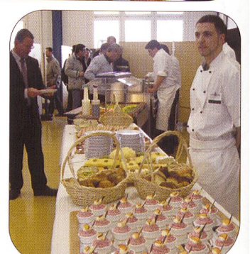
Weitere Impressionen vom Rundgang.