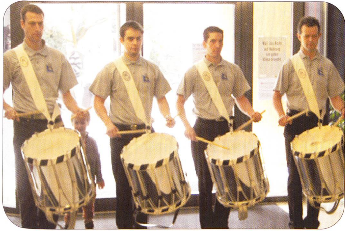
Militär-Tambouren begleiteten den so genannten Meilenstein für schweizerische Ernährungsgeschichte.