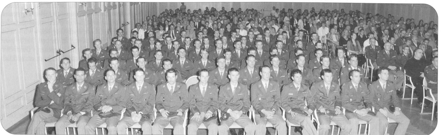
Am 29. Mai wurden im Casino Bern 73 Anwärter zu Logistik-Offizieren befördert.