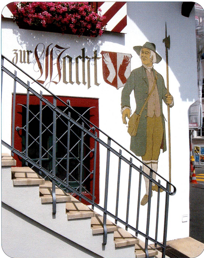
SISSACH. – Am 24. April findet im Schloss Ebenrain die 55. Delegiertenversammlung des VSMK statt. Neben dem geschäftlichen Teil und frohem Beisammensein lädt das Städtchen Sissach (BL) mit seinen vielen Sehenswürdigkeiten ebenfalls zum gemütlichen Flanieren ein. Die Traktandenliste finden Sie auf Seite 3 in dieser Ausgabe.

LE PATRON BIETET IHNEN EIN ABWECHSLUNGSREICHES ANGEBOT, TÄGLICH WECHSELNDE MENUS SOWIE VERSCHIEDENE SPEZIALITÄTEN.