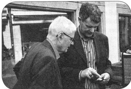
Ehrenmitglieder unter sich