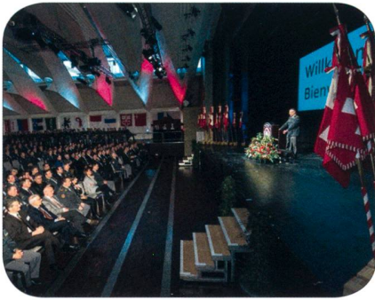
500 Offiziere und Unteroffiziere im Saal Bärenmatte, Suhr AG