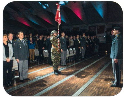
Br Kaiser beim Fahnenmarsch