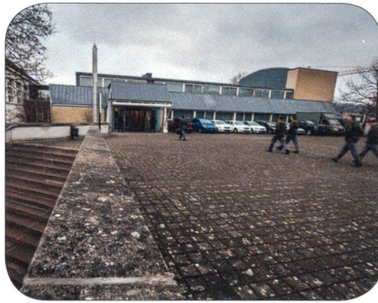
Bärenmatte, Suhr AG