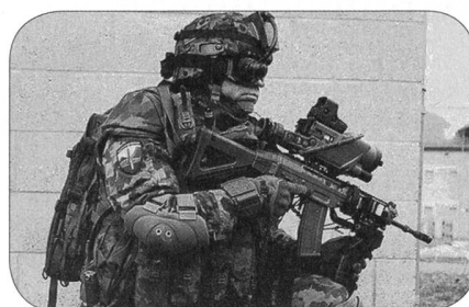
Oberst Roland Haudenschild

Quelle: Logistikbasis der Armee 1 Stand per 31. Dezember 2014 2 Stand per 31. Dezember 2013 3 Stand per 31. Dezember 2012 Quelle: Jahresbericht Schweizer Armee 2014, 2015 Schweizer Armee, Eidgenössisches Departement für Verteidigung, Bevölkerungsschutz und Sport