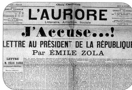
Émile Zola J'accuse topelement

Comment a-t-on pu espérer qu'un conseil de guerre déferait ce qu'un conseil de guerre avait fait? Je ne parle même pas du choix toujours possible des juges. L'idée supérieure de discipline, qui est dans le sang de ces soldats,